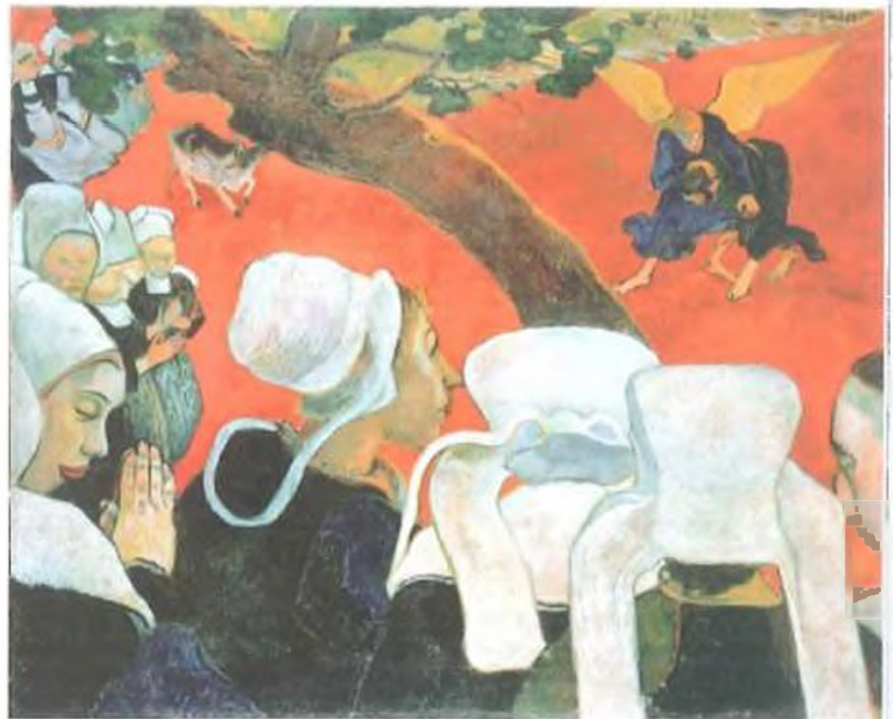
PAUL GAUGUIN: La visión después del sermón (1888). Gauguin utilizó el color de manera arbitraria con fines sugestivos. Aquí el rojo del prado enmarca la tumba de Jacob con un ángel, objeto del sermón al que han asistido las mujeres.