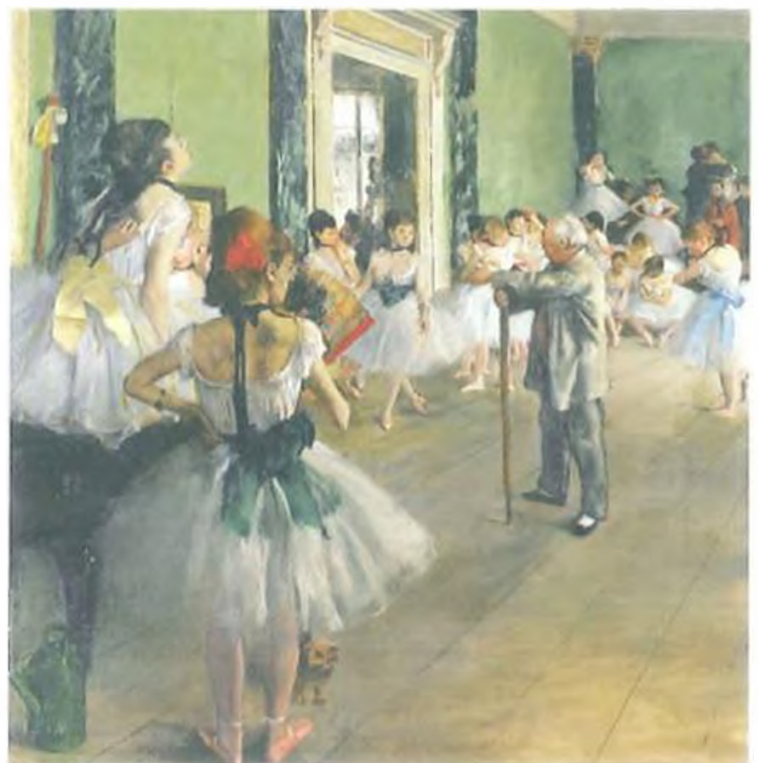
EDOUARD DEGAS: La clase de danza (1874). Museo de Orsay, París. A partir de 1870, Degas representó asiduamente bailarinas, en ensayo o en reposo, buscando la espontaneidad desde múltiples perspectivas con cortes bruscos en la composición y planos insólitos para la pintura de la época.

Georges Seurat llamó divisionismo a la base teórica de esta corriente y puntillismo a su técnica de ejecución, que consiste en la división de un tono en sus componentes a base de pequeñísimos puntos de colores puros, que el ojo aglutina formando el color final desecado por el artista. Seurat empieza a elaborar esta teoría basada en la óptica de los colores y pintó el cuadro Una tar-