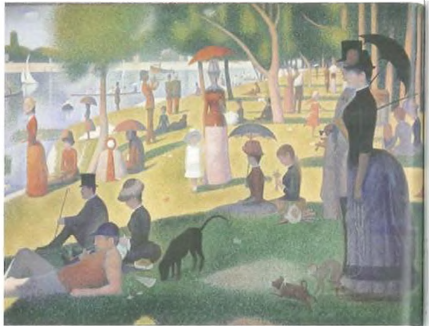
GEORGES SEURAT: Una tarde de domingo en la gran Jatte (1884-1886). Las figuras o grupos de siluetas similares se repiten rítmicamente creando direcciones visuales oblicuas, al tiempo que áreas alternadas de sombra y de sol crean amplias zonas horizontales.