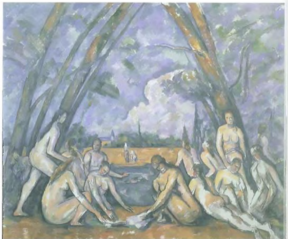
PAUL CEZANNE: Grandes bañistas (1898-1900). Más allá del tema, Cézanne se preocupó por el modo de representación de la realidad, sobre todo en la forma y la estructura de las figuras. Sus avances en este terreno, geometrizando los volúmenes, fueron las bases del cubismo.