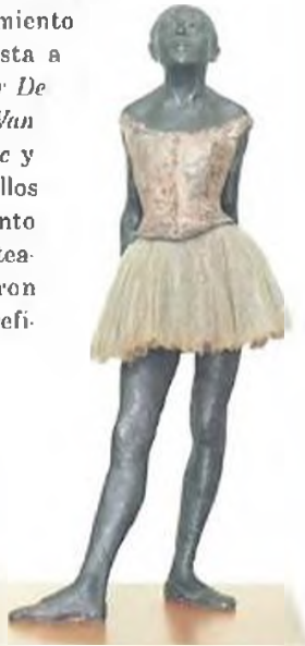
EDGAR DEGAS: Bailarina de ballet de 14 años (1880). Museo de Orsay, París. El modelado es la principal característica de la escultura de Degas, quien pretende reproducir la textura no pulida de sus pinturas al pastel.

En estos mismos años aparecieron nuevos signos de alejamiento del movimiento impresionista a través de las obras de Edgar Degas, Paul Cezanne, Vincent Van Gogh, Henry Toulouse Lautrec y Paul Gauguin. Para todos ellos el Impresionismo fue un punto de partida, pero en sus planteamientos pictóricos apostaron por caminos opuestos que prefiguran el arte del s. XX.