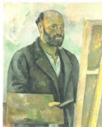
Cézanne: Autorretrato (1885-1887).

Paul Cézanne empezó los estudios de arte a inicios de la década de 1860 en la Academia Suiza de París, animado por el escritor Émile Zola, quien le había presentado a Manet y Courbet. Allí coincidió con los impresionistas Monet, Pissarro y Renoir, y estuvo vinculado a este movimiento durante la década de 1870, pintando al aire libre. Sin embargo, pronto dejó de lado el realismo y se interesó más por el análisis estructural de la pintura. A través de bodegones, retratos y paisajes de la Provenza, Cézanne inició un camino en solitario en el que sentó las bases de la revolución de las primeras vanguardias.