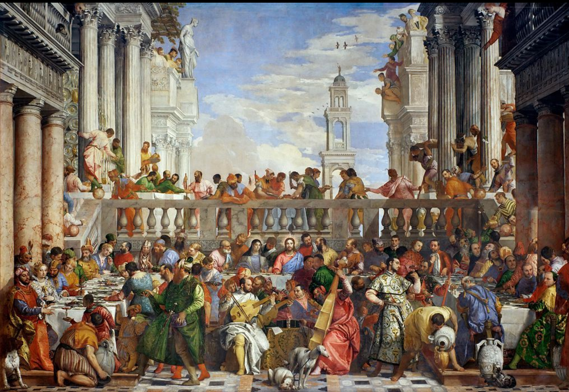
Las bodas de Caná, 1563.