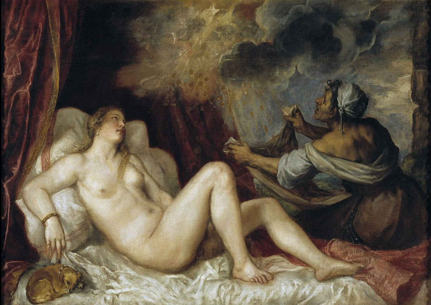
Dánae recibiendo la lluvia de oro. Tiziano, hacia 1553. 129,8 cm x 181,2 cm1. Museo del Prado