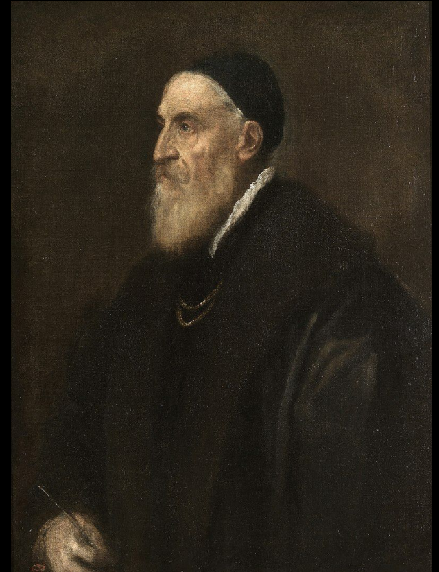
Autorretrato, hacia 1562. Óleo sobre lienzo, 86 x 65 cm, Madrid, Museo del Prado.