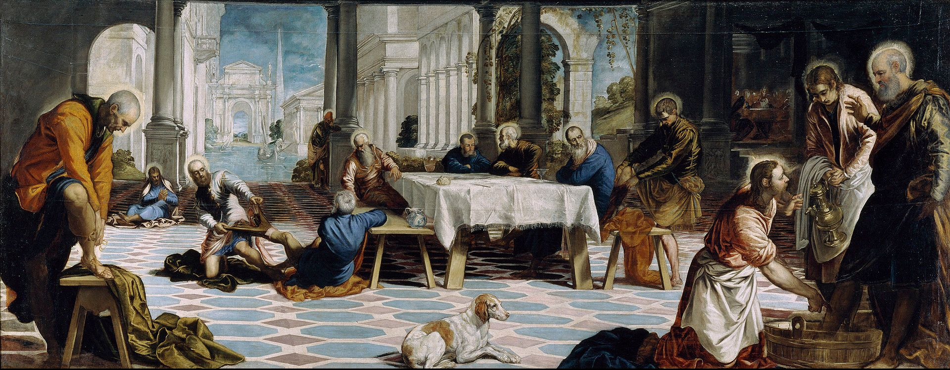
El Lavatorio (La lavanda dei piedi). Tintoretto, 1548-1549, Óleo sobre lienzo, 210 cm x 533 cm, Museo del Prado, Madrid, España