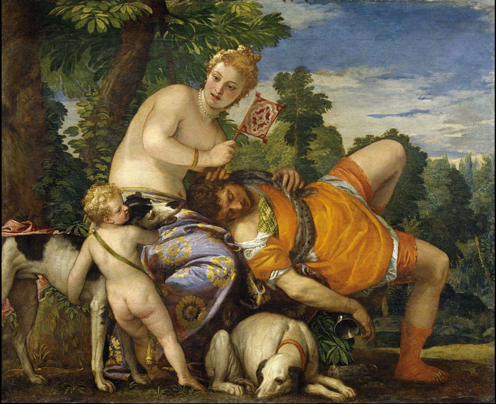
Venus y Adonis (Venere e Adone) Paolo Veronese, 1580, Óleo sobre lienzo, 162 cm x 191 cm, Museo del Prado, Madrid, España