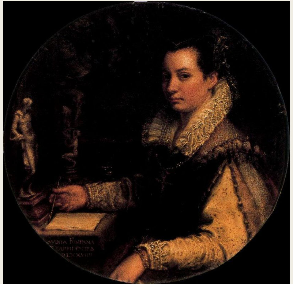
Autorretrato de Lavinia Fontana conservado en los Uffizi.