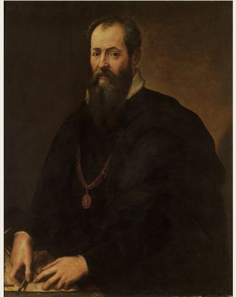
Giorgio Vasari (1511-1574)

“Pues si las mujeres son capaces de hacer tan bien a los seres humanos al darles. La vida, ¿cómo puede maravillarnos que aquellas que lo desean sean capaces de hacerlos igualmente bien pintándolos?”