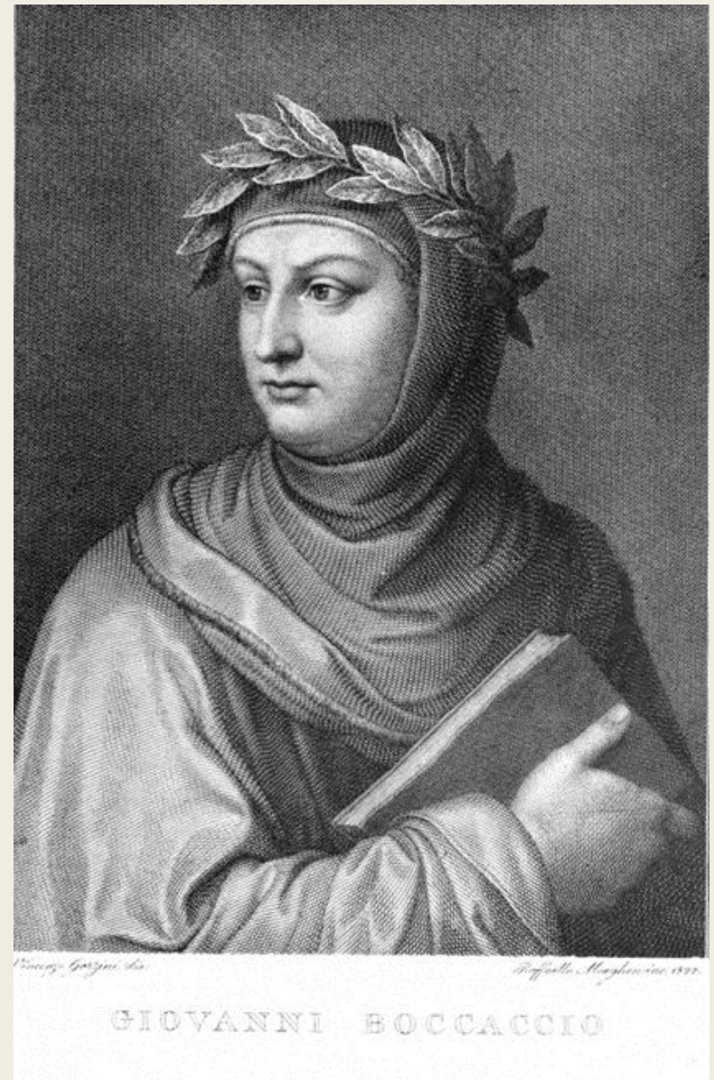
Giovanni Boccaccio (1313 -1375)

“El arte es ajeno al espíritu de las mujeres, pues esas cosas sólo pueden realizarse con mucho talento, cualidad casi siempre rara en ellas. “