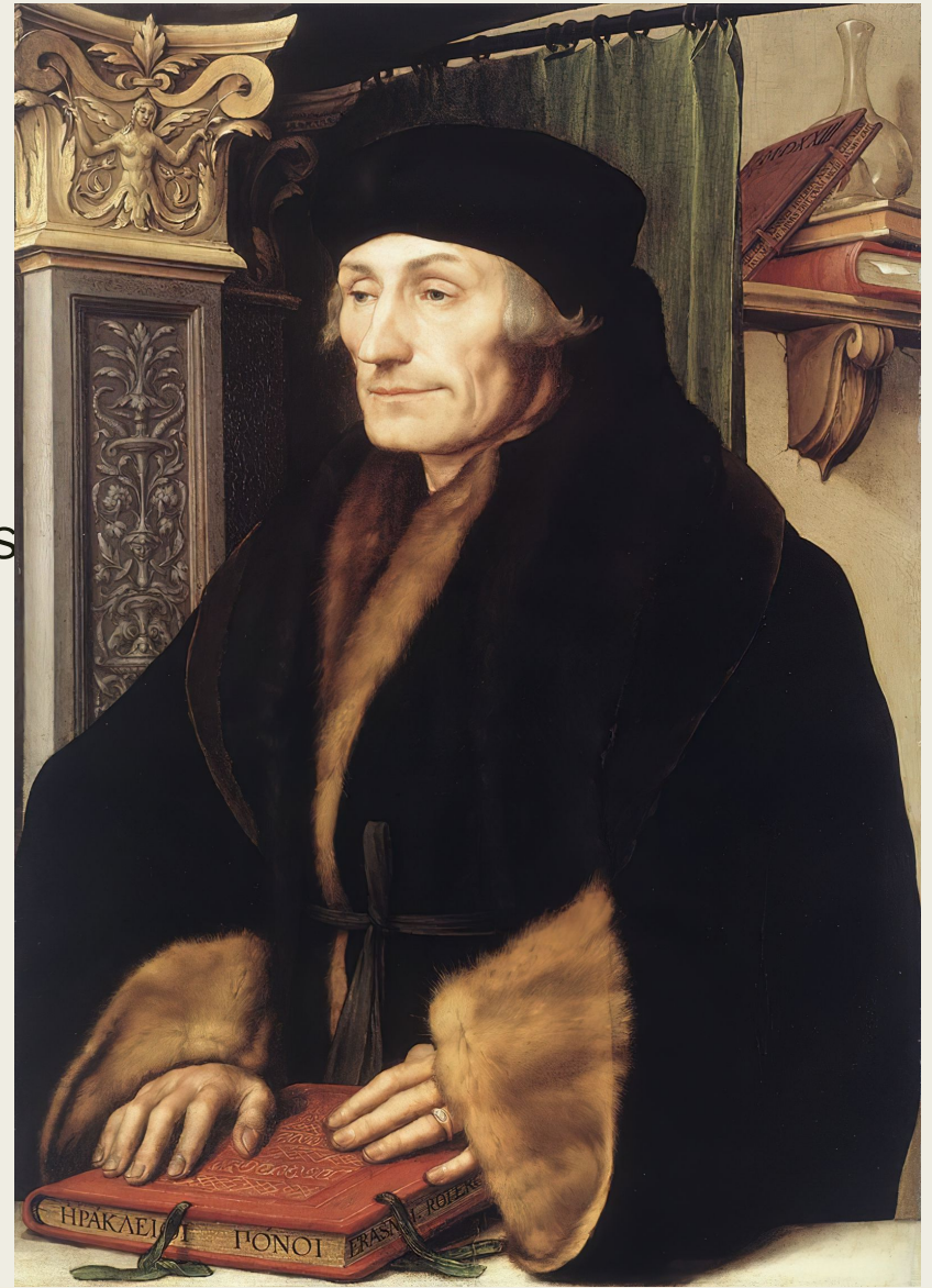
Erasmus de Róterdam (1466-1536)

“Por eso una mujer es siempre mujer, es decir, loca, por muchos esfuerzos que realice para ocultarlo.”